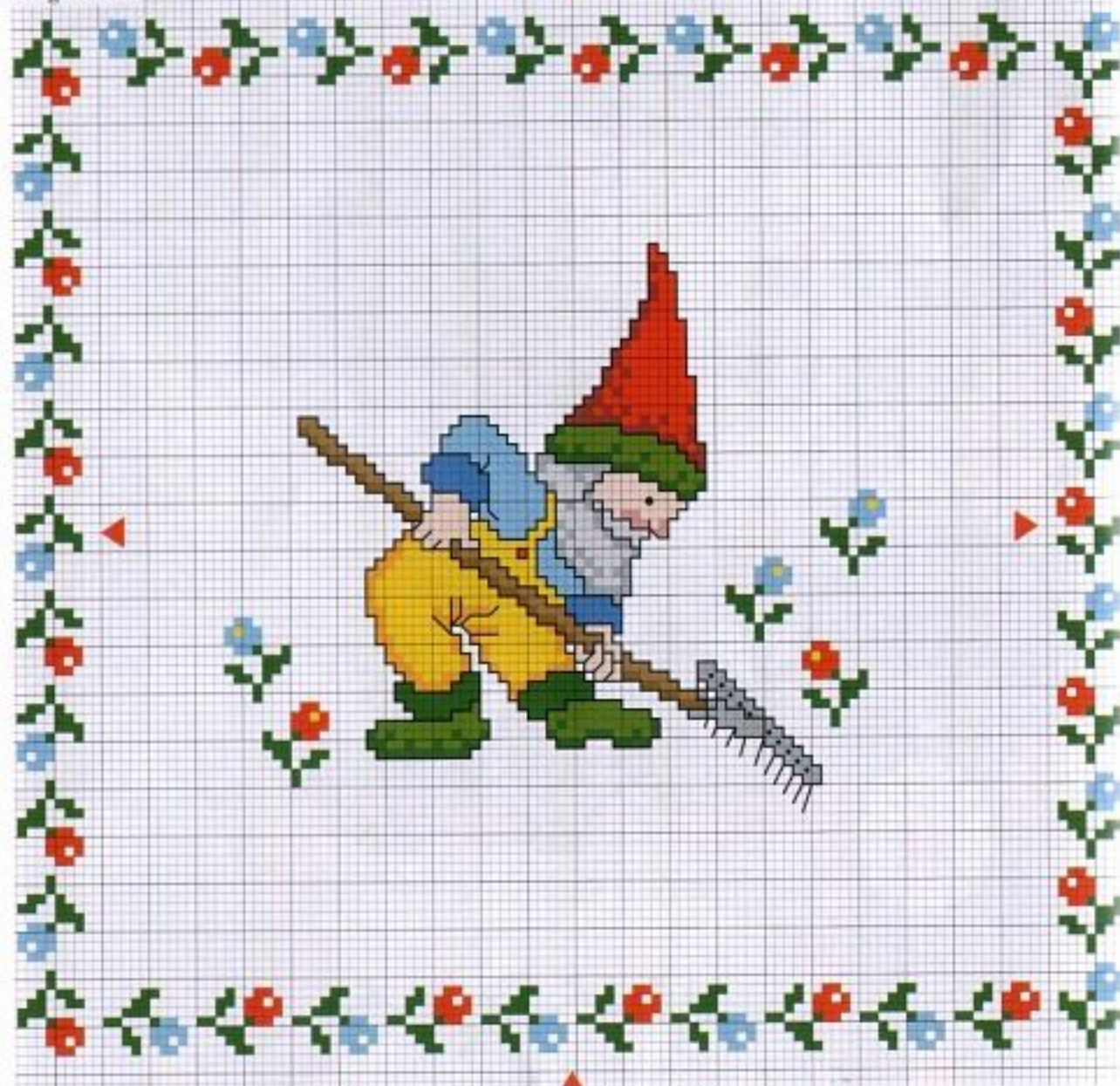
Motiv-Mitte/centre of design/centre du motif/midden van het motief

Sticktivist und Garnverbrauch in ganzen Strängen